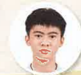
常識科答題程式設計