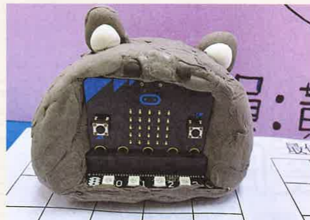
多功能夜行輪椅燈

跨學科專題研習是近年學校常用的教學模式，旨在透過多元化的活動，提升學生的學習動機，並冀望小朋友能夠在日常生活中觀察，學以致用。中華基督教會基慈小學以「傷健共融」作為跨學科專題研習的主題，鼓勵同學使用STEAM相關知識去創建有助改善殘疾人士生活的智能裝置，從而令他們對殘疾人士的生活有更深入的理解。此外，該校亦希望啟發學生運用編程知識解決問題，並將其應用於實際的設計方案上，因此提供計算思維課程，探索如何將編程與現代科技趨勢，如元宇宙家居設計、3D打印技術及軟件程式開發相結合，讓學生透過教學與實作，學習必要的技能與知識，培養他們的計算思維，並在日常生活和未來的職業生涯中運用。