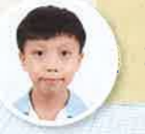
周年校慶3D打印書籤設計